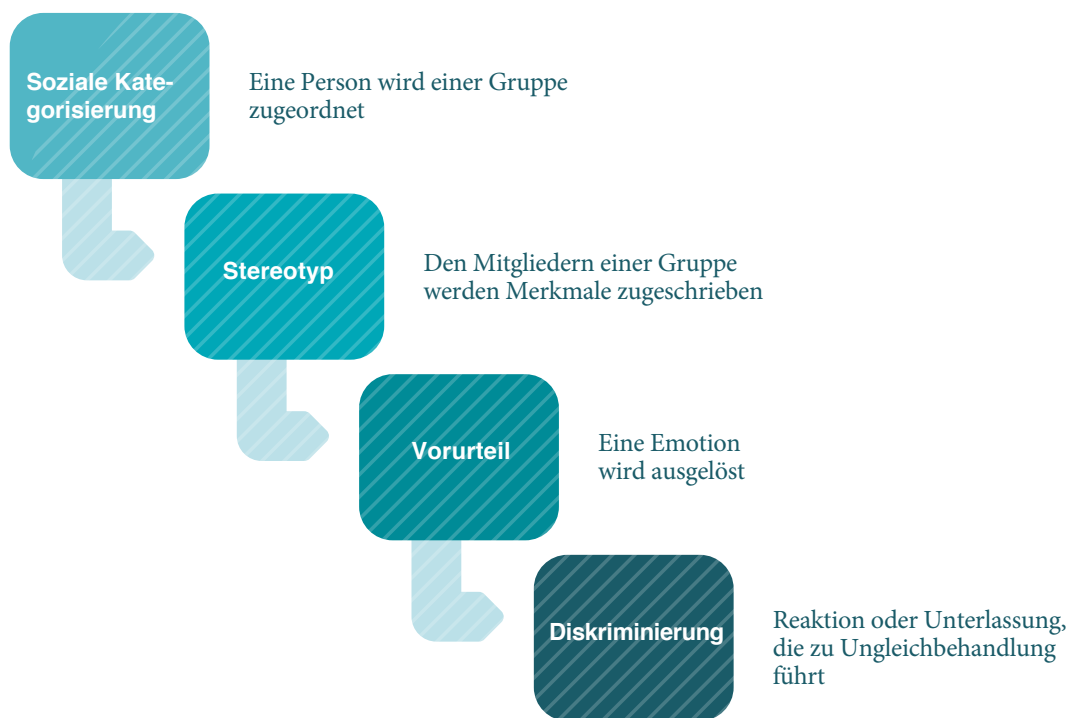
Abbildung 1: «Konstruktion» der Diskriminierung

Darstellung des Prozesses, der zu einer diskriminierenden Handlung führt.