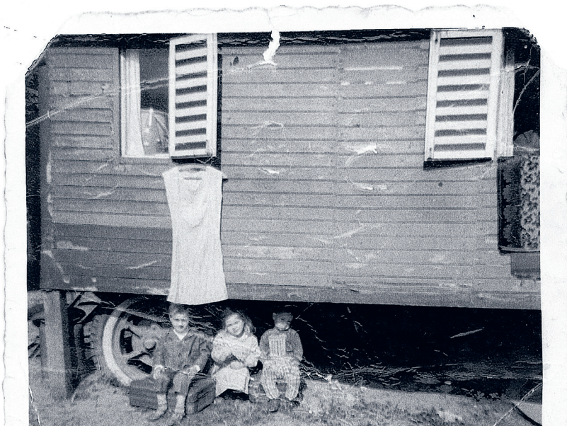
Foto: Bildarchiv Radgenossenschaft der Landstrasse, DZRG-AV-5065-Fx-999-0070; keine weiteren Angaben zu den dargestellten Personen.

Jenische Eltern: Korberin und Händler beim Hausieren unterwegs. Es handelt sich um Verwandte von Eva Moser (siehe Interview). Die Bilder stammen aus den 1920er-Jahren, als die Kindswegnahmen begannen, die bis Anfang der 1970er-Jahre weitergingen.