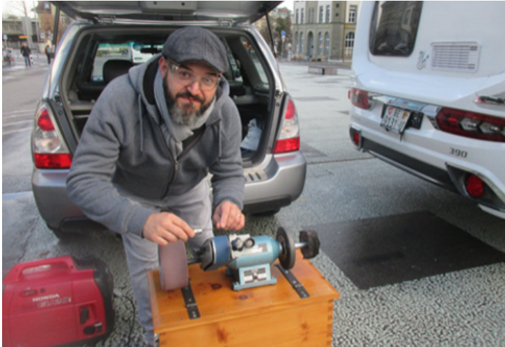
Ein Jenischer beim Messerschleifen