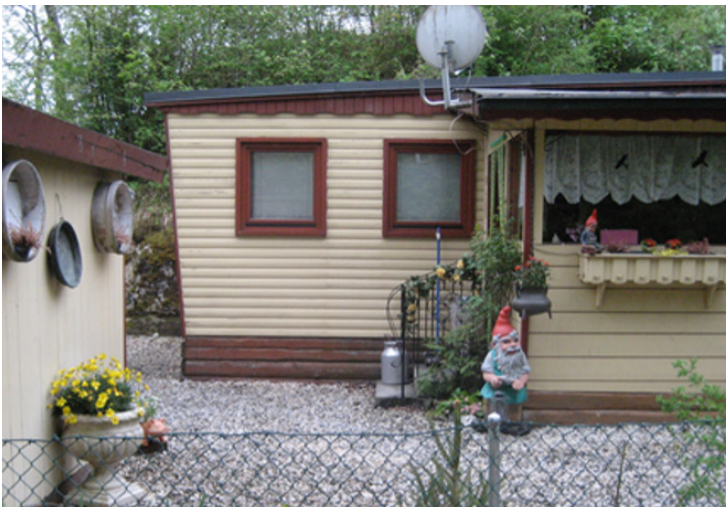
Chalet einer jenischen Familie

Ich war fast vierzig Jahre mit meinem Mann zusammen. Leider ist er gestorben. Seit dreissig Jahren wohne ich in einem aus Holz gebauten Chalet auf einem Platz für Jenische in Chur. Mir gefällt es hier. Unser Chalet hat ein Elternzimmer, eine Stube, zwei Kinderzimmer, die Küche, das Bad. Hier sind meine zwei Kinder aufgewachsen. Und von hier sind sie zur Schule gegangen.